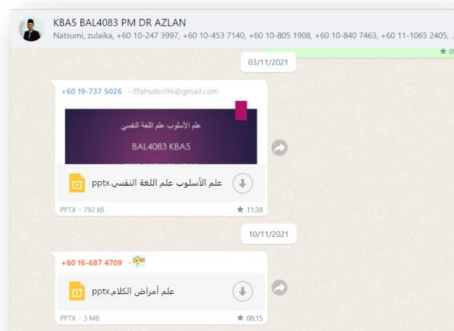
Rajah 2: Contoh Pembelajaran Norma Baharu Melalui Aplikasi Dalam Talian

Rajah 2: Contoh Lain Pembelajaran Norma Baharu Melalui Moodle Pembelajaran