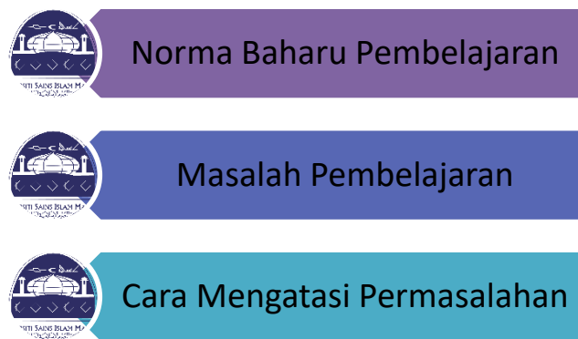
Rajah 1: Hasil dapatan kajian persepsi pelajar terhadap pembelajaran BAL4083

Pembelajaran dalam talian pada masa kini merupakan satu keperluan. Kajian ini diwujudkan untuk melihat sejauh mana keberkesannya dalam kalangan pelajar Universiti Sains Islam Malaysia (USIM), khususnya pelajar Fakulti Pengajian Bahasa Utama (FPBU). Menurut Hairun Najuwah, Wazzainab, Ku fatahiyah, Awatif (2020) perubahan ke arah PdP secara maya ini sememangnya memberi cabaran yang besar bukan sahaja kepada para pelajar, malah memberi impak yang besar kepada kaedah pengajaran para pensyarah. Antara hasil dapatan kajian ini boleh dibahagikan kepada tiga kategori yang utama iaitu kondisi norma baharu pembelajaran, masalah pembelajaran yang dihadapi oleh pelajar dan cara mengatasi masalah tersebut yang cuba dilakukan oleh mereka.