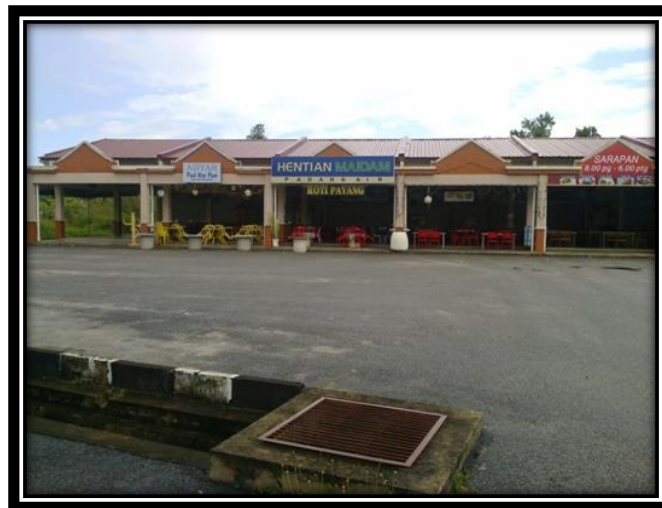
Rajah 1: Premis perniagaan MAIDAM di Kampung Padang Air, Kuala Nerus

Salah satu bangunan wakaf yang menjadi perhatian dalam kajian ini adalah premis perniagaan yang berada di kampung Padang Air, Kuala Nerus, Terengganu. Bangunan ini terletak di atas tanah wakaf iaitu lot 5730 GM 3069 Mukim Kuala Nerus dan luas tanah pula 0.374 hektar bersamaan 0.936 ekar. Projek pembinaan bangunan ini siap dibina sepenuhnya pada tahun 2012 dan mempunyai lima unit, setiap unit berkeluasan sekitar 15 kaki (lebar) x 25 kaki (panjang). Selain itu, kawasan sekitarnya mempunyai tempat parking yang luas sehingga boleh memuatkan 20 kenderaan dalam satu masa yang sama. Premis perniagaan ini telah disewakan oleh para peniaga untuk jualan makanan pagi dan malam seperti jualan roti canai, nasi lemak, nasi minyak, masakkan panas dan sebagainya (Jalil Ngah, 2020). Gambar rajah di bawah menunjukkan bangunan wakaf berkenaan sebagaimana berikut: