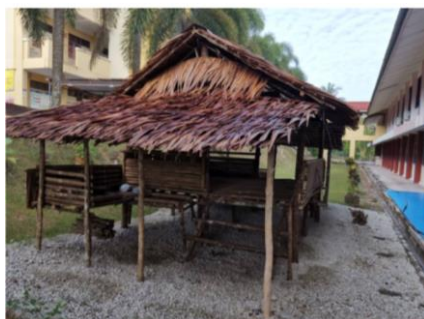
Rajah 1: Pondok belajar pelajar Orang Asli