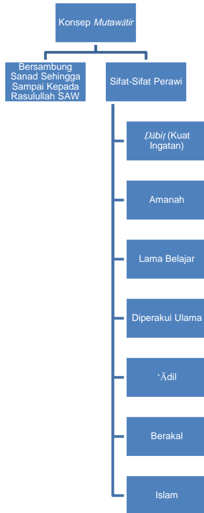
Rajah 2: Elemen-elemen Konsep Mutawatir

dan yang seumpama dengannya. Perawi itu juga hendaklah jarang melakukan dosa-dosa kecil yang tidak memberi kesan kepada ‘adatnya (Rafiq Ahmed, 2000:72)), berakal, dan Islam (Ibn Jazari, 2014:54; al-Suyuti , t.t:78; Subhi Salih, 1993:121). Bagi mendapatkan gambaran yang lebih jelas, hal ini dipamerkan dalam Rajah 2.