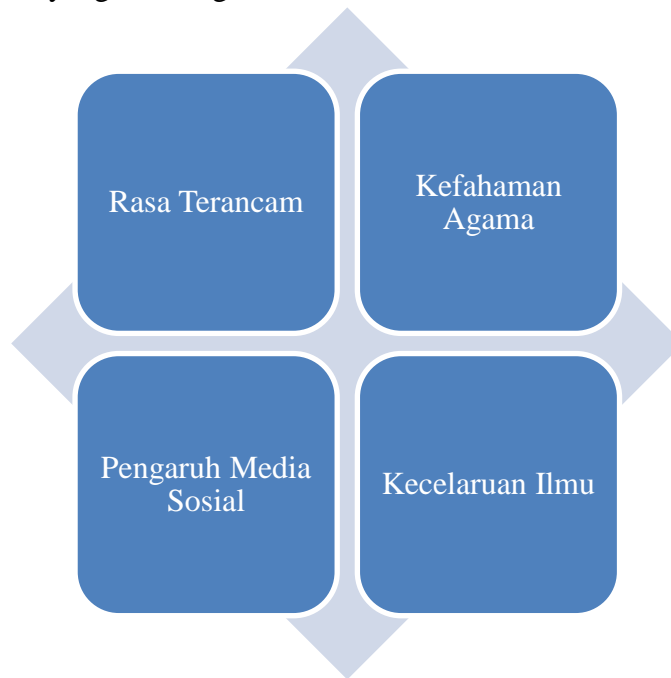
Rajah 2: Faktor Penglibatan Kegiatan Ekstremisme

Justeru, empat faktor yang diketengahkan iaitu: